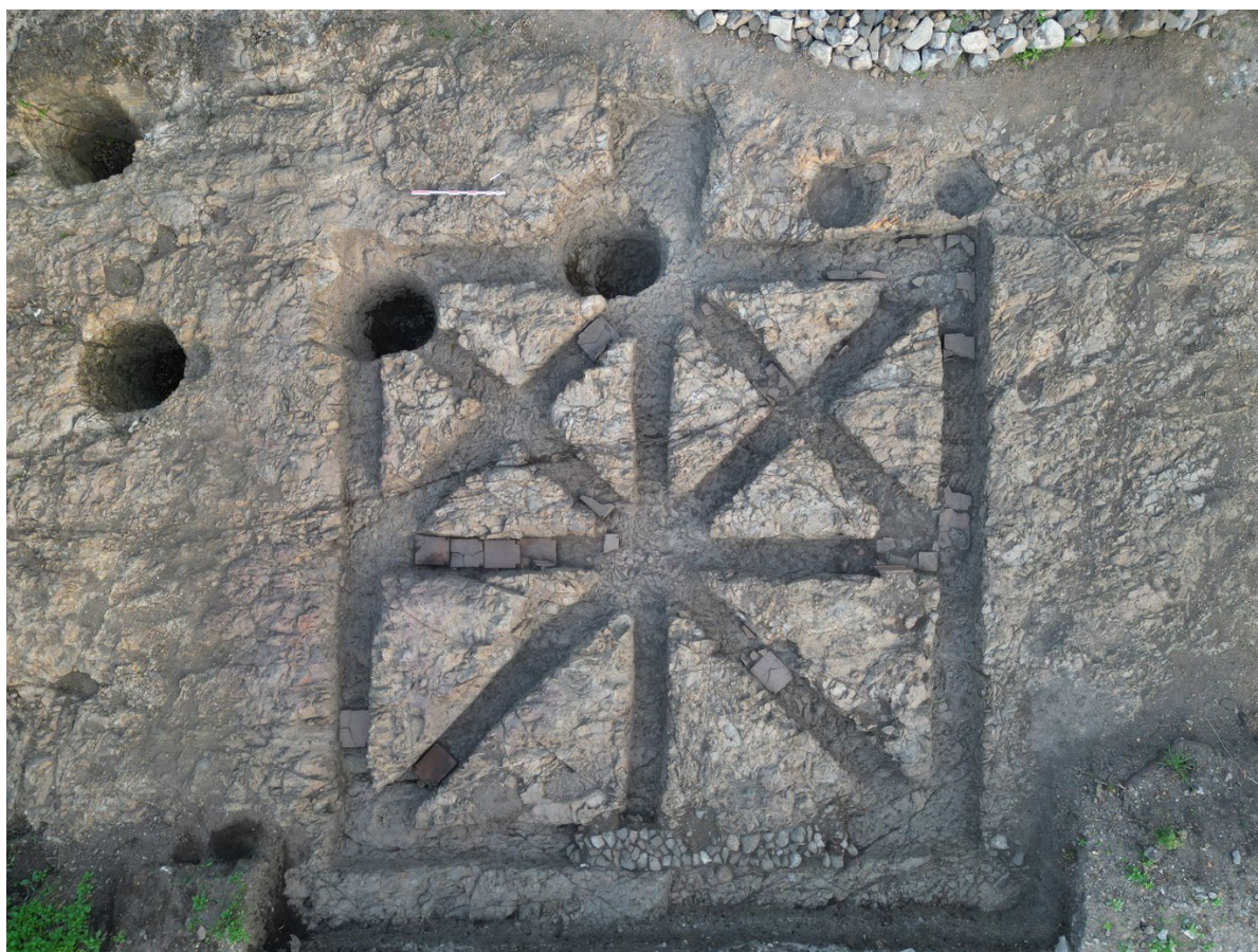
Système de chauffage par canaux rayonnants – Ve siècle (site de la Couronne, Molles, 03). Fouille programmée 2024. RO : Damien Martinez (Univ Lyon II, UMR 5648 CIHAM).

Organisées par la DRAC Auvergne-Rhône-Alpes Service Régional de l'Archéologie